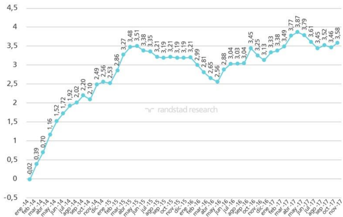
Variación intermensual de la afiliación a la Seguridad Social en España